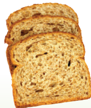
Pão de trigo

500 litros de água por um pacote de 1 kg