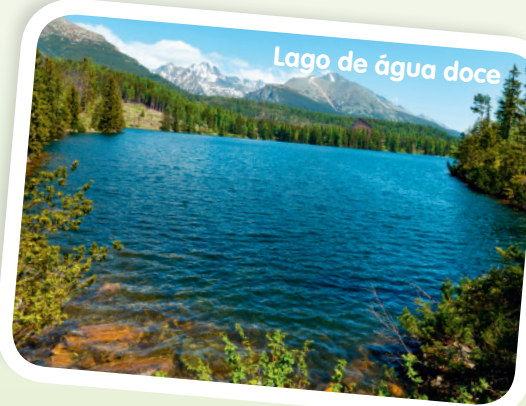
Lago de água doce